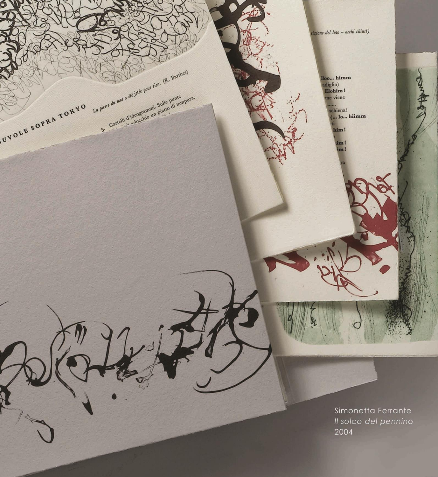
Simonetta Ferrante Il solco del pennino 2004