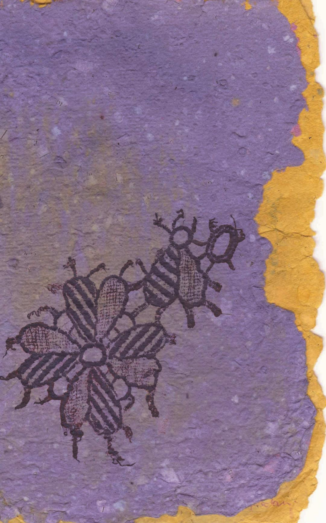
Sara Montani La cicala e la formica 2006