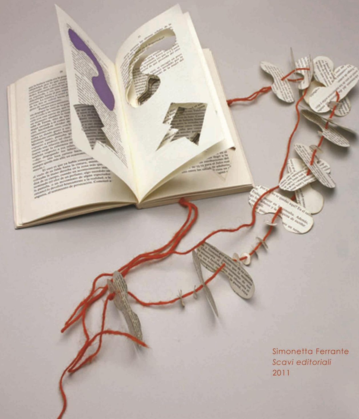
Simonetta Ferrante Scavi editoriali 2011