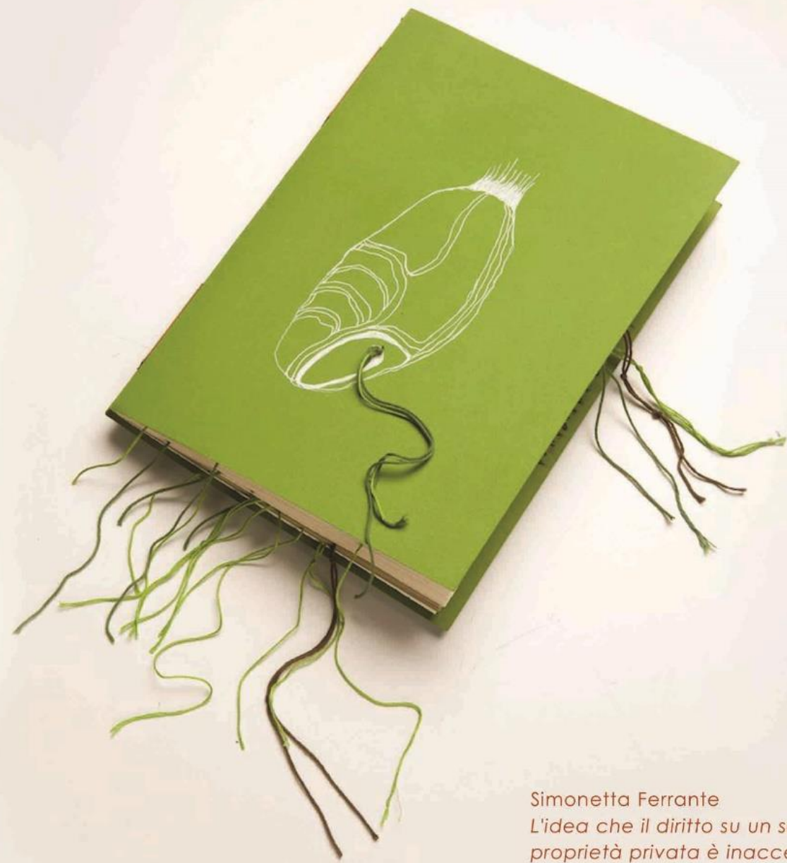
Simonetta Ferrante L'idea che il diritto su un seme sia proprietà privata è inaccettabile 2015