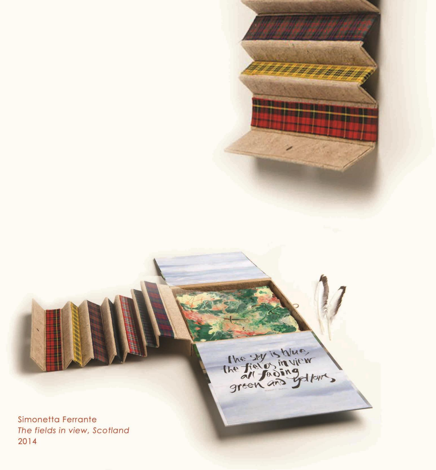
Simonetta Ferrante The fields in view, Scotland 2014